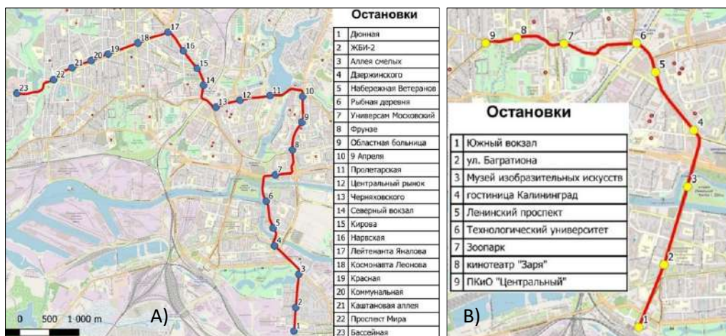
Рис. 2. – Картосхемы трамвайных маршрутов №5 (А) и №3 (В) (сост. с исп. ГИС QGIS)

транспорта как местных жителей, так и туристов. Однако такая простота лишь кажущаяся, поскольку требуется учитывать большое количество разнообразных факторов, что на практике реализовать очень не просто вследствие жёсткой «привязки» трамвая к рельсовому пути, что является принципиально неразрешимой проблемой. Раздельную или индивидуальную рельсовую инфраструктуру для экскурсионных и обычных трамваев создавать нет возможности. Кроме того, эта проблема усугубляется значительными финансовыми затратами на приобретение и эксплуатацию трамвайного подвижного состава и при этом необходимы гарантии окупаемости инвестиций в трамвайное сообщение.