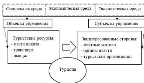
Рис. 1 – Концептуальные положения дестинации в туризме (сост. на осн. [3, 4])

ного развития субъектов туристского бизнеса. Дестинация рассматривается как объект туристского предложения и специфический объект управления в туризме в единстве целевых детерминантов. Модель дестинации является интегрированной функцией таких переменных как: туристские ресурсы, туристская инфраструктура, институциональная среда и система механизмов управления в туризме, брендинг, трансформационный потенциал устойчивого развития. Сформулированное понятие «дестинация» представляет собой многоаспектную системную научно-практическую категорию, включающую одновременно определённые черты, такие как: менеджмент – объект и субъект управления, маркетинг – спрос и предложение, экономика – субъект хозяйственной деятельности.