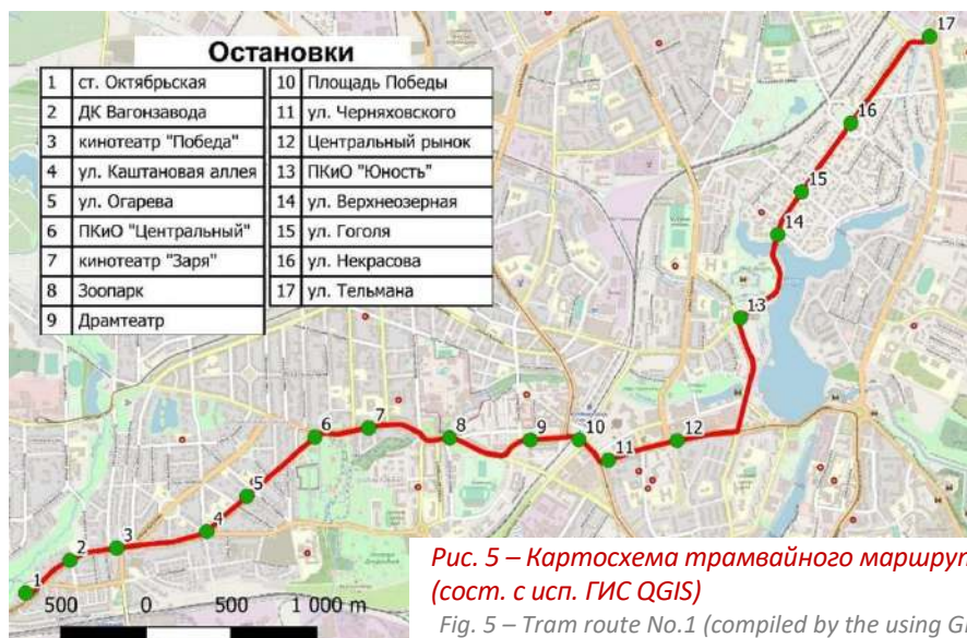
Рис. 5 – Картосхема трамвайного маршрута №1 (сост. с исп. ГИС QGIS)

Fig. 5 – Tram route No.1 (compiled by the using GIS QGIS)